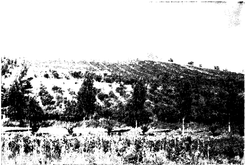
Сл. 3. — Платнашки виноград и воћњак код Гроцке. На доњим деловима стране засад бресака, а на горњим винове лозе.