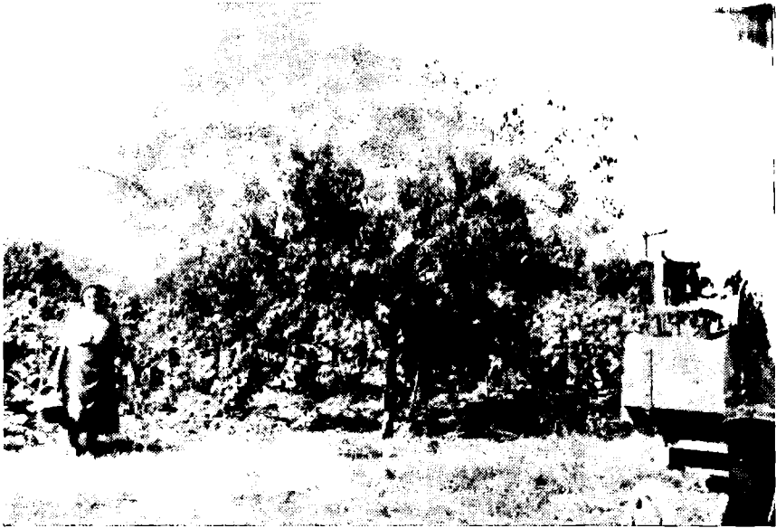
Сл. 2. — Културе винове лозе и бресака на истој површини (Пејзаж из Ритопека)