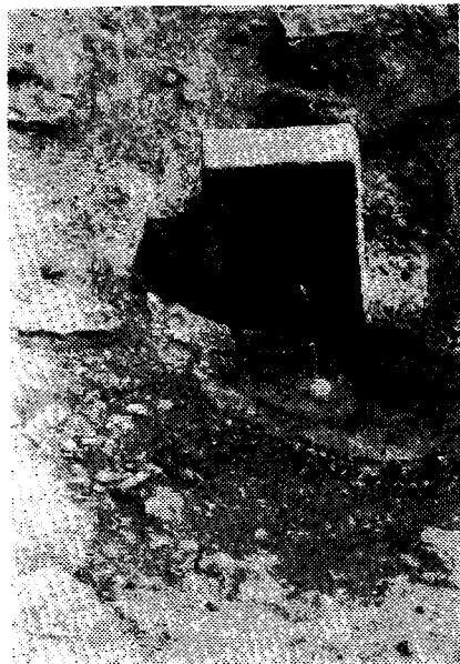
Сл. 2. — Чесма са минералном водом у Витановачкој Бањи. Ову чесму, непрекидног истицања на једној лули, подигла је група грађана октобра 1971. године