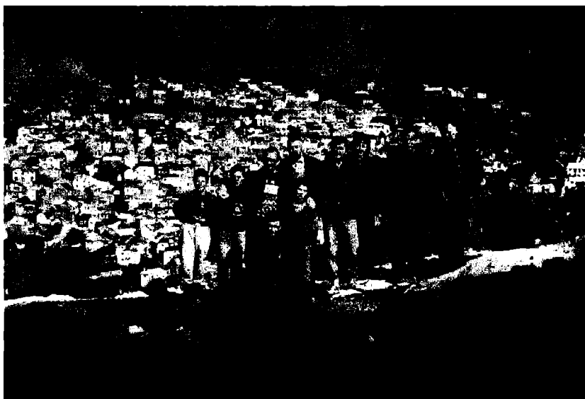
Фотографија 3: Сарадници Географског института изнад Реселице