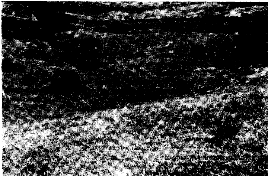
Сл. 1. Низ вртача на Јагодњи

Идући путем од Мачковог камена (923 м) ка Крупњу, испод Нешиног брда као западног дела Јагодње, у зони букве и подзоласог земљишта карстификована је површ од 850 м и то вртачама пречника 50—80 м и дубине 4—5 м. Дна су им уравњана разидијалном глином.